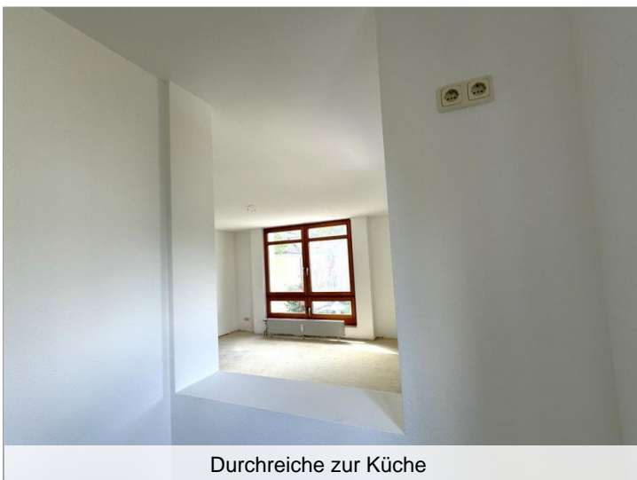
Durchreiche zur Küche