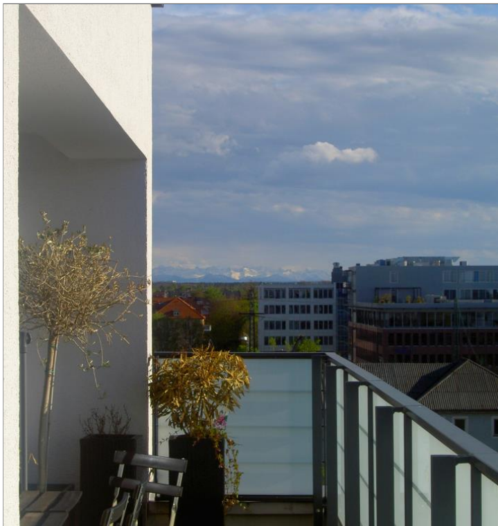
Dachterrasse mit Blick gen Berge