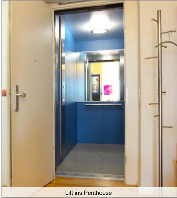
Lift ins Penthouse