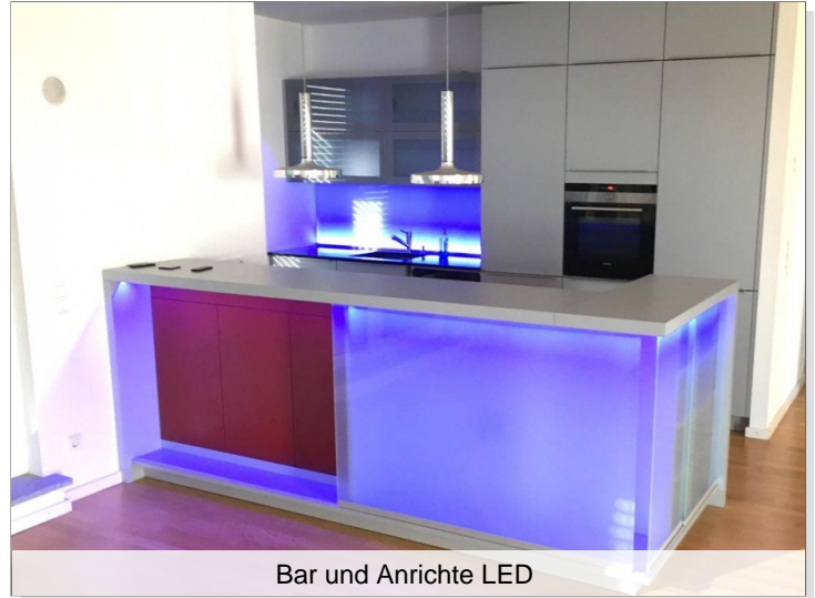
Bar und Anrichte LED