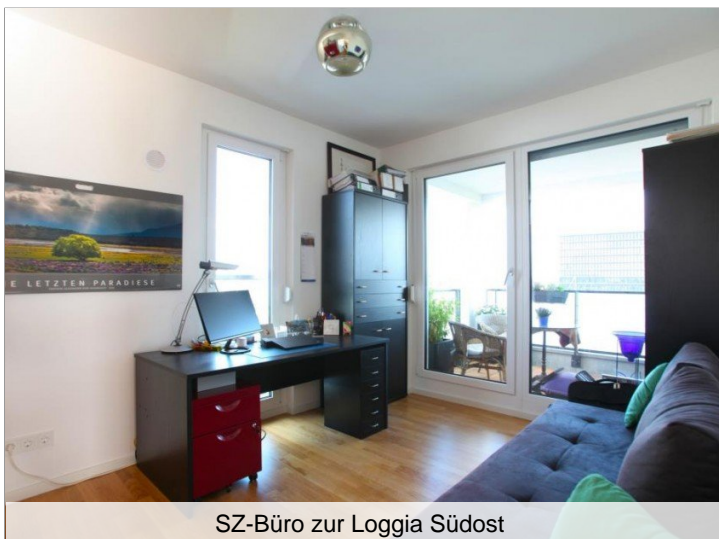
SZ-Büro zur Loggia Südost