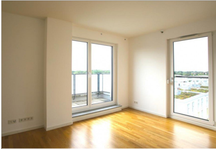
Schlafzimmer mit Zugang zu Westterrasse