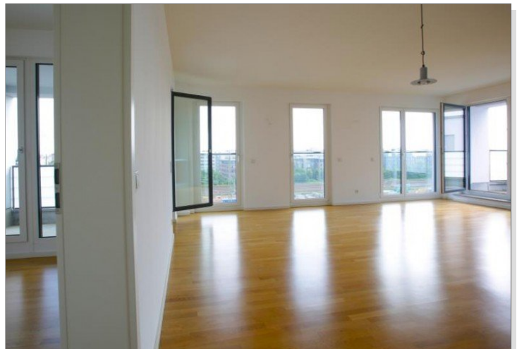
Blick ins Büro mit Loggia und Wohnzimmer Richtung