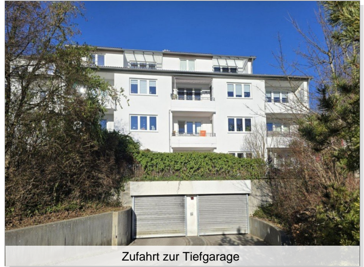
Zufahrt zur Tiefgarage