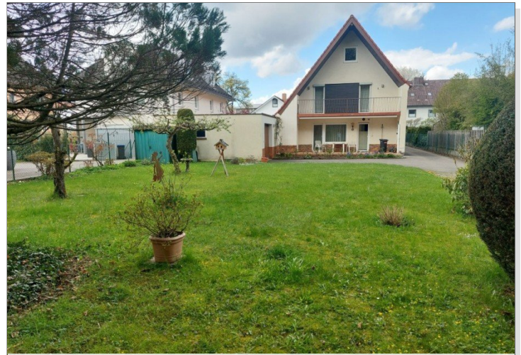
Grundstück Ansicht Altbestand