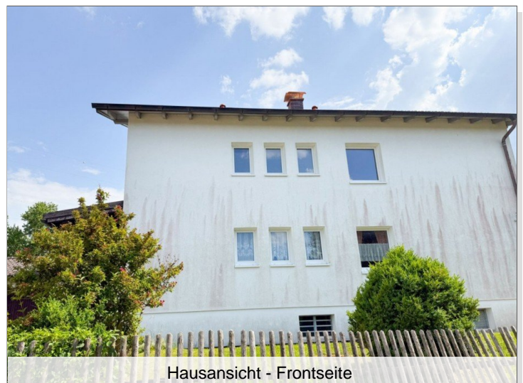
Hausansicht - Frontseite