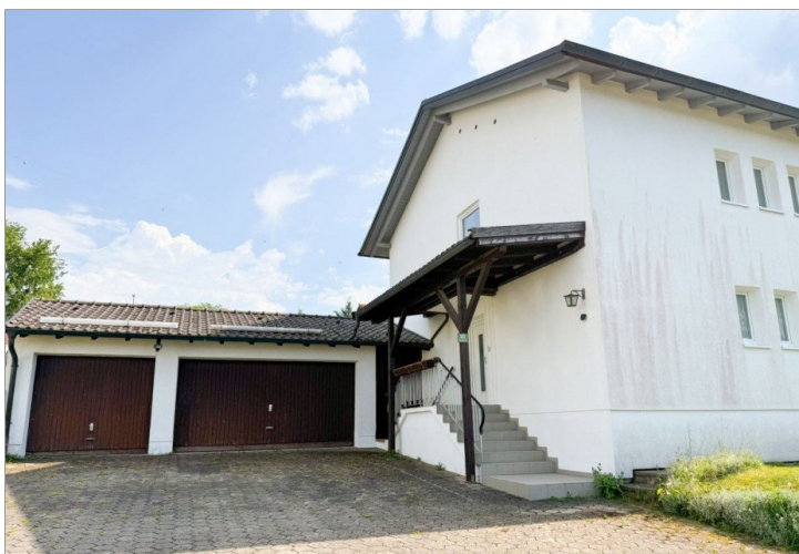
Hausansicht - Eingangsseite